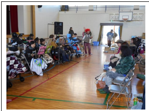
浅香山小学校との 交流会